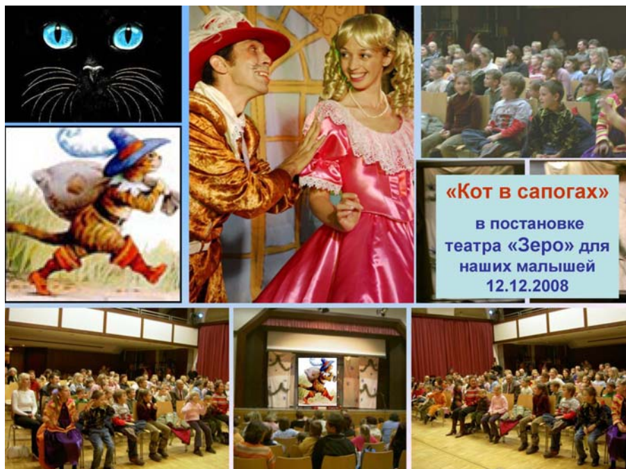
Коллаж Людмилы Лобовой

Новогодняя сказка «Кот в сапогах» совместно с театром «Зеро»