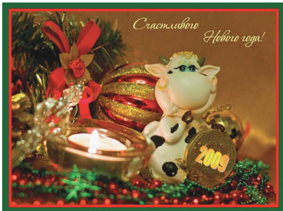
Коллаж Людмилы Лобовой

DGRW желает Вам и Вашим близким зорюва и счастья в 2009 году!